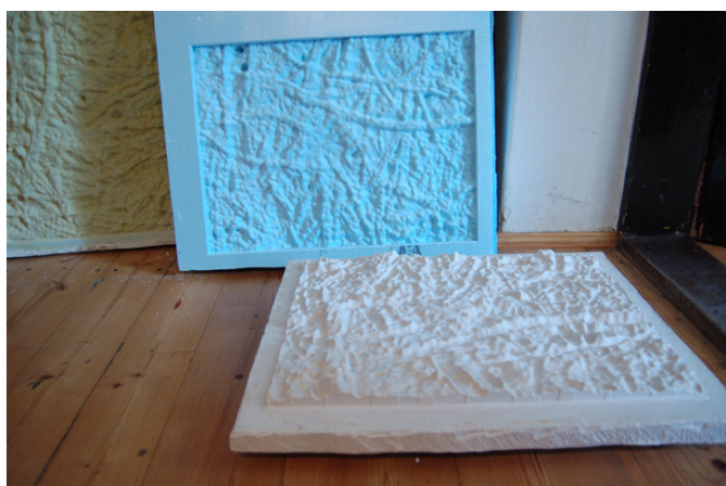
název: Struktura roviny materiál/technologie: Sádrový odlitek a frézovaný styrodur výška x šířka x hloubka v cm: 39 x 51 cm rok vzniku: 2010