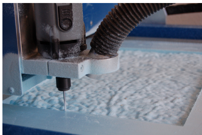
název: Struktura roviny materiál/technologie: Styrodur/fréza výška x šířka x hloubka v cm: 39 x 51 cm rok vzniku: 2010