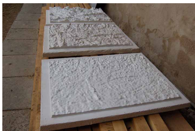
název: Struktura roviny materiál/technologie: Sádrové negativy výška x šířka x hloubka v cm: 39 x 51 cm rok vzniku: 2010